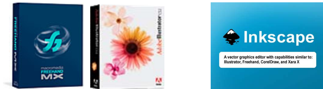
Freehand i Illustrator, actualment d'Adobe vs. Inkscape, software lliure de codi obert